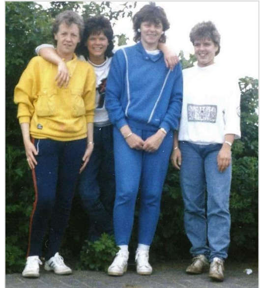
◀ Voor de wedstrijden korfinspectie.

► De feestcommissie die deze heugelijke dag organiseerde.